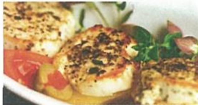
Gebackener Schafskäse mit Tomaten und Zwiebeln 7,50