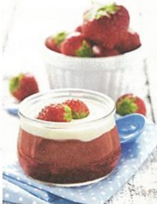
Rote Grütze mit Vanillesoße 4,50