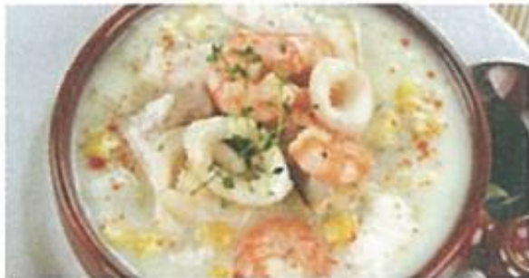
Französische Fischsuppe 8,00