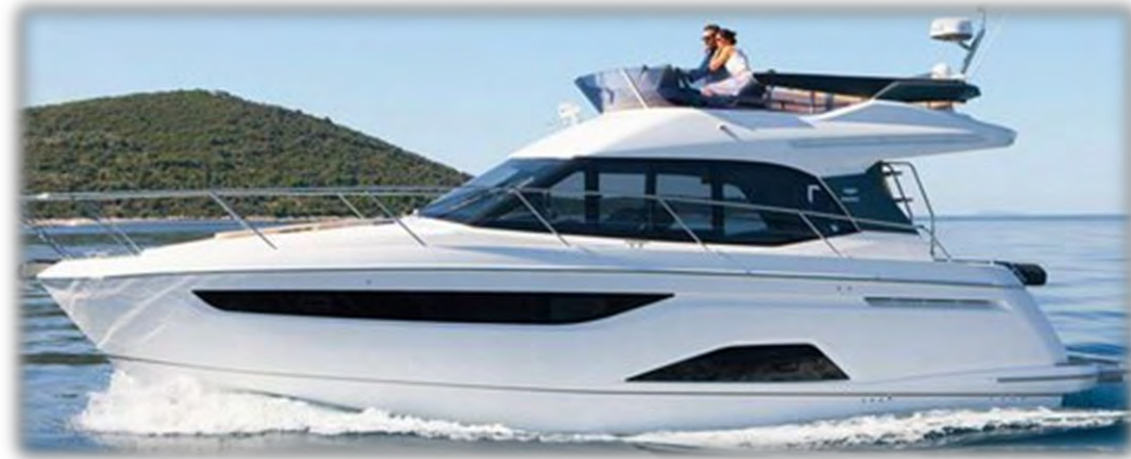
die Yacht / die Jacht