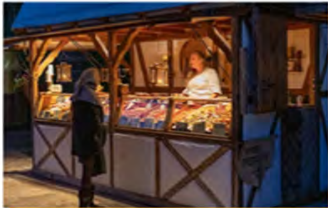
Standbewerbung für Markthändler