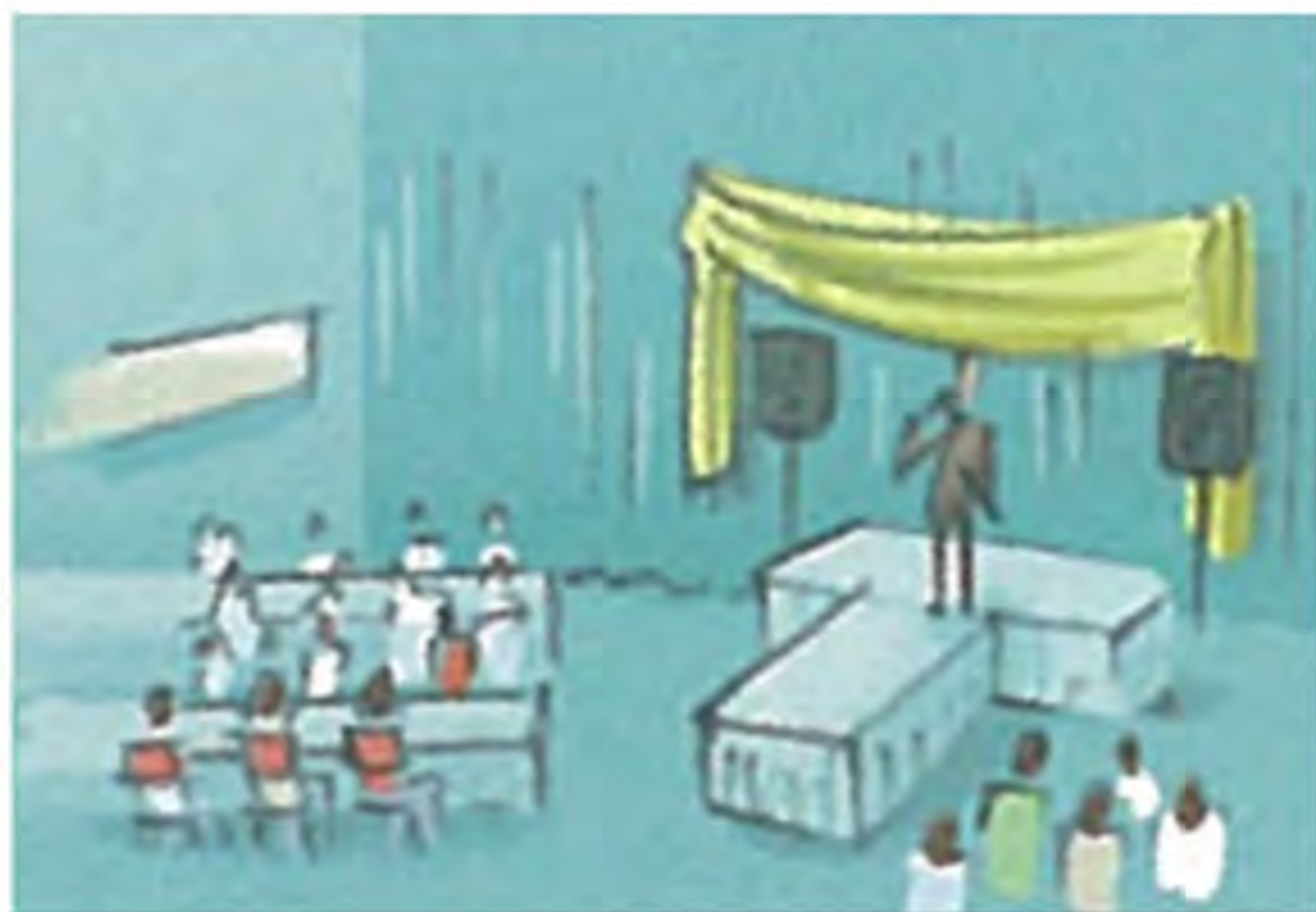
V e r a n s t a l t u n g

Arbeiten Sie zu zweit. Sehen Sie das Bildlexikon an und erraten Sie die Wörter.