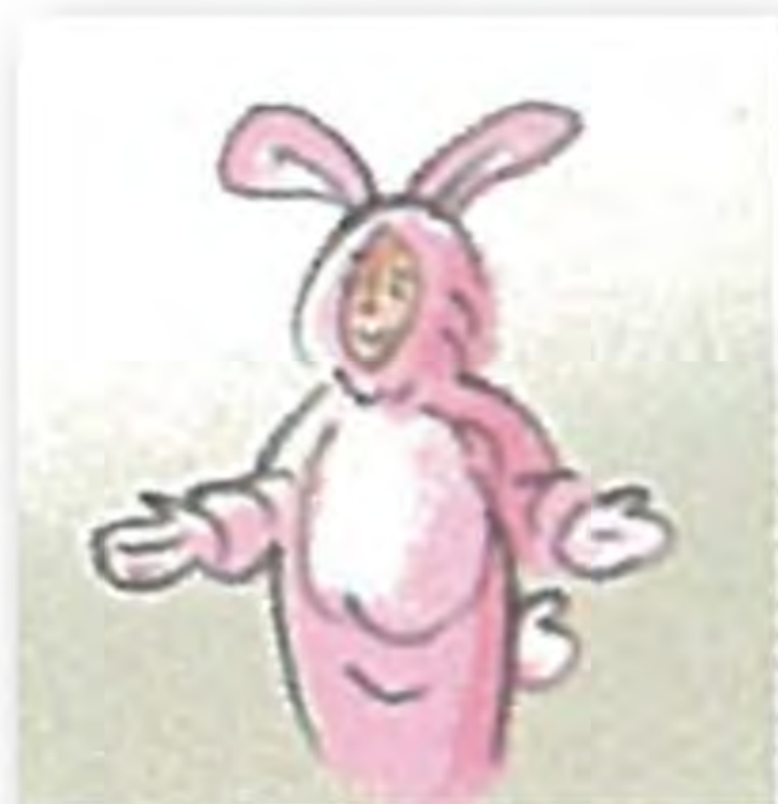
Ko s t ü m