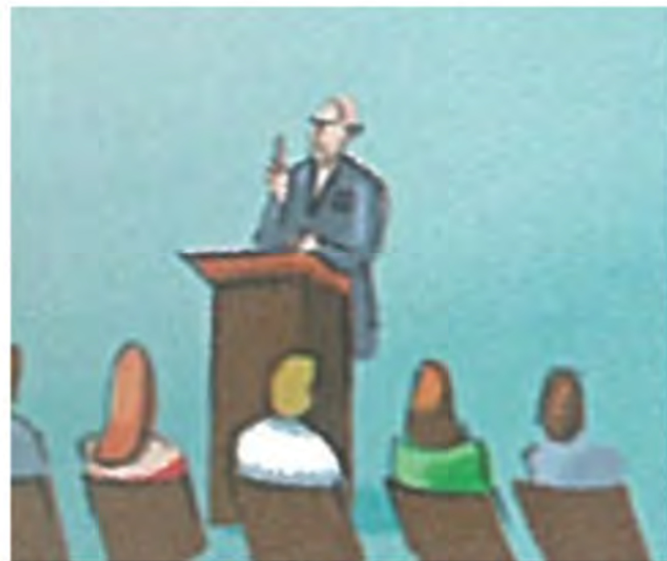
V o r t r a g