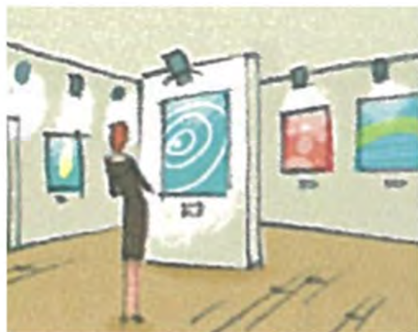
Aus s t e l l u n g

Arbeiten Sie zu zweit. Sehen Sie das Bildlexikon an und erraten Sie die Wörter.