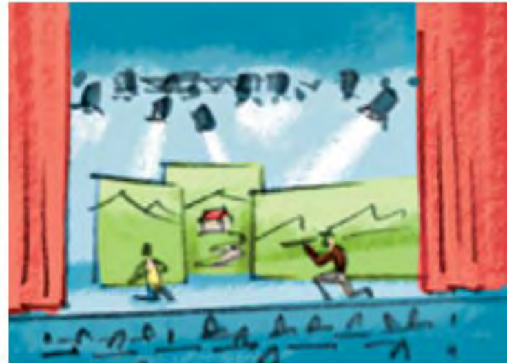
T h e a t e r s t ü c k