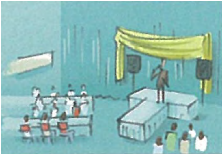
V e r a n s t a l t u n g

Arbeiten Sie zu zweit. Sehen Sie das Bildlexikon an und erraten Sie die Wörter.