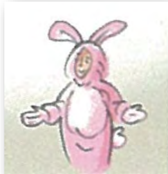
Ko s tü m