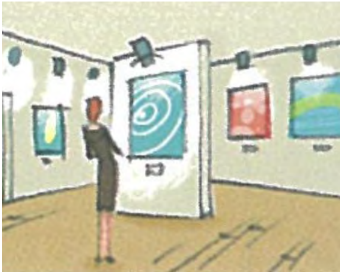
Aus s t e l l u n g

Arbeiten Sie zu zweit. Sehen Sie das Bildlexikon an und erraten Sie die Wörter.