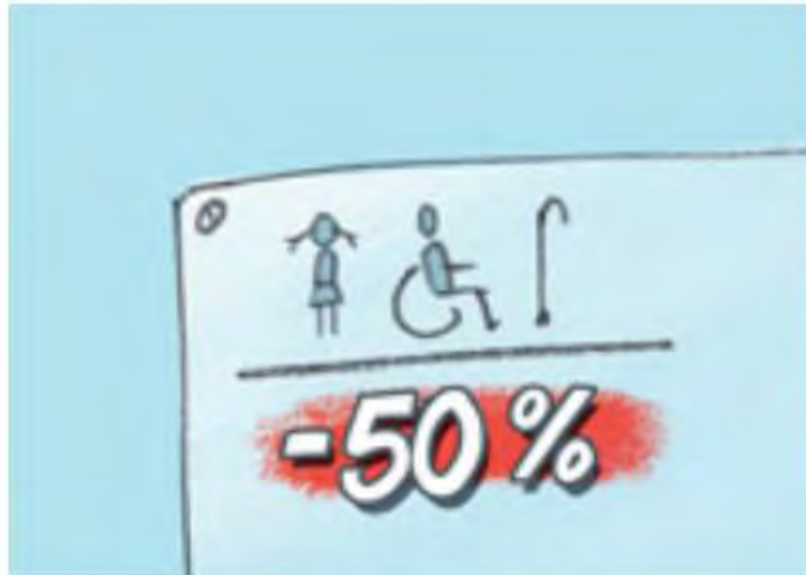
E r m ä ß i g u n g

Arbeiten Sie zu zweit. Sehen Sie das Bildlexikon an und erraten Sie die Wörter.