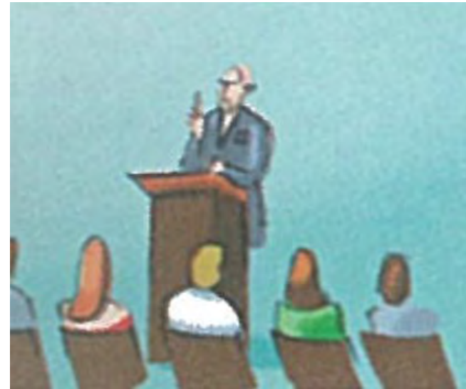
V o r t r a g