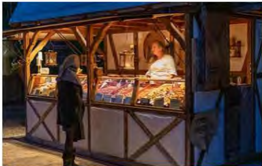
Standbewerbung für Markthändler