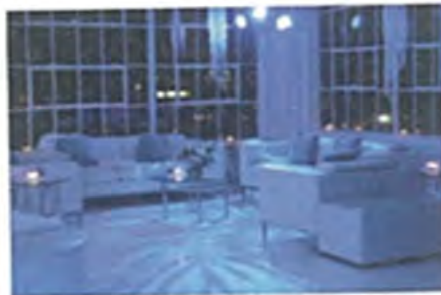
Club – schick