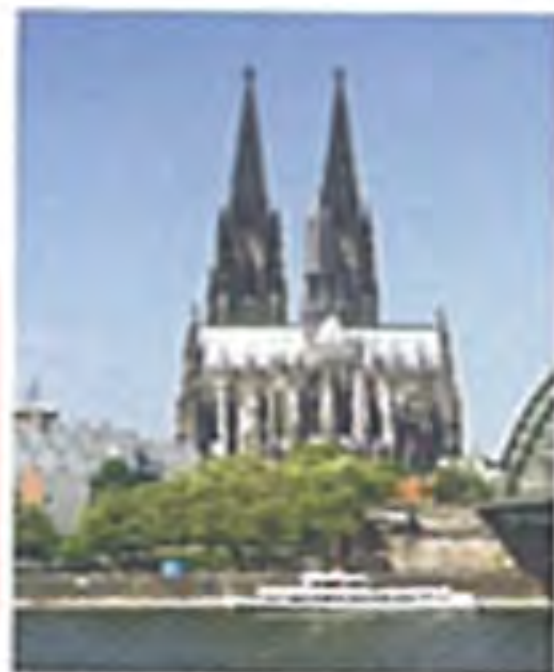
Dom – berühmt