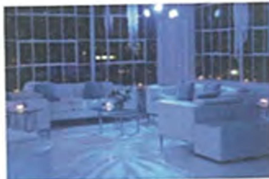
Club – schick