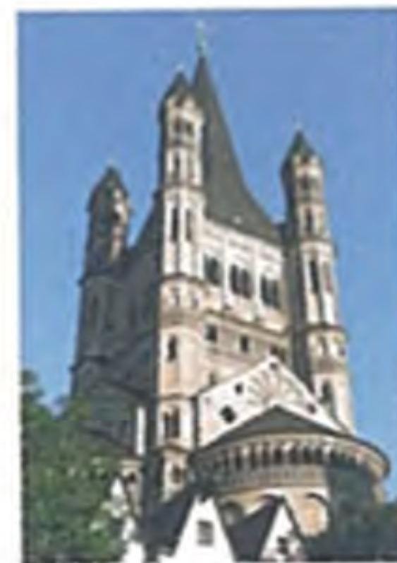
Klosterkirchen – groß