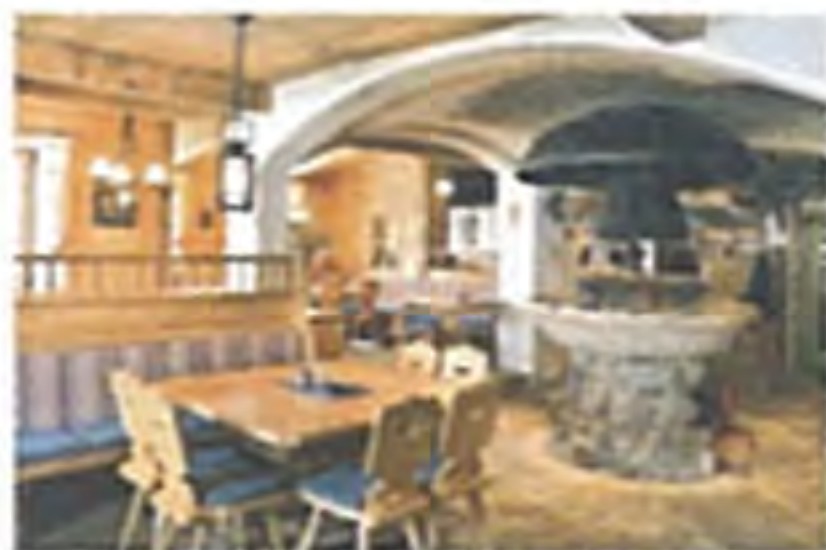
Restaurant – deutsch