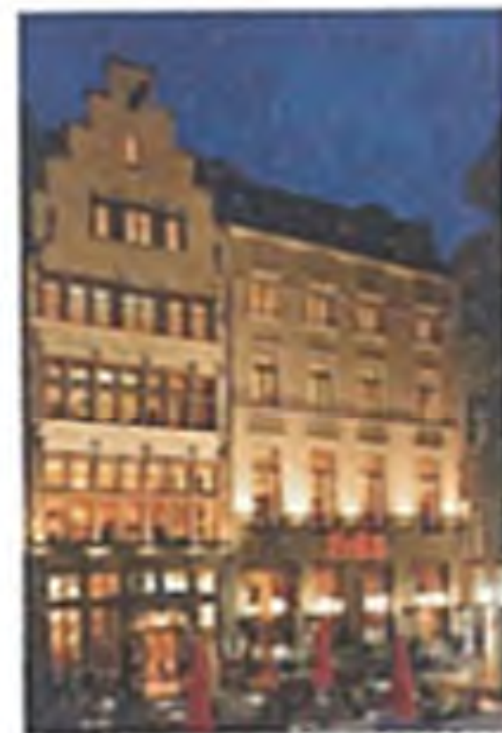
Brauhaus – traditionell