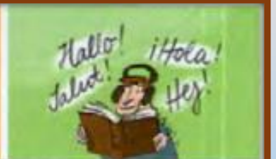
viele Fremdsprachen lernen