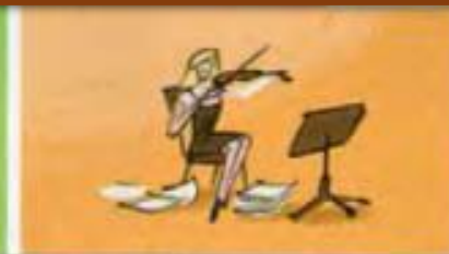
ein (Musik)Instrument lernen