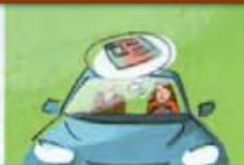
den Führerschein machen