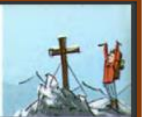
auf einen Berg steigen