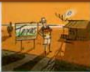
im Ausland leben