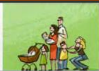
eine große Familie haben