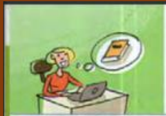
ein Buch schreiben