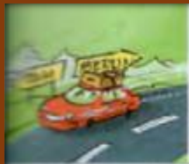
durch Europa reisen