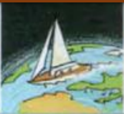
um die Welt segeln