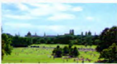
① Blick vom Monopteros