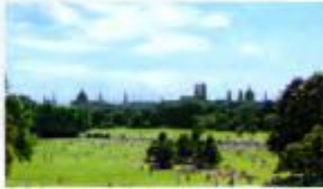
① Blick vom Monopteros