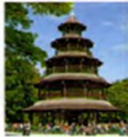
○ Chinesische Turm

20 Nach einem Kilometer komme ich zum Chinesischen Turm. Den finde ich besonders toll. Er ist 25 Meter hoch und ganz aus Holz. Auch hier gibt es einen Biergarten. Er hat 7.000 Sitzplätze und ist bei Einheimischen und Touristen sehr beliebt. Manchmal spielt 25 im Turm eine bayrische Blasmusik für die Gäste.