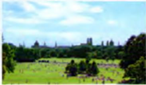
① Blick vom Monopteros