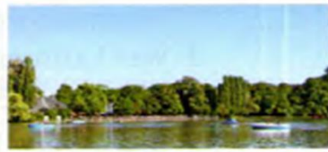
○ Kleinhesseloher See

Der Englische Garten in München ist mehr als 200 Jahre alt und er ist seit 1792 für alle Menschen geöffnet. Wir finden das heute ganz normal, aber im 18. Jahrhundert war es noch etwas Besonderes. So viel ‚Volksnähe‘ war in den meisten Ländern Europas nämlich noch nicht üblich.