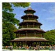
○ Chinesischer Turm