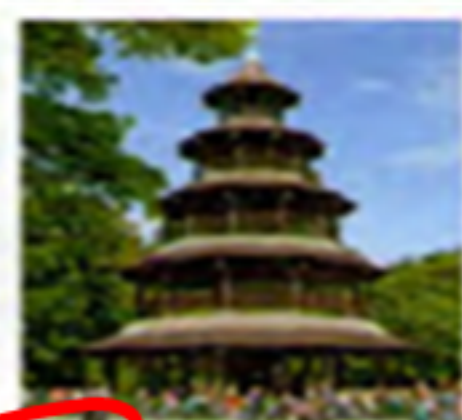
3 Chinesischer Turm