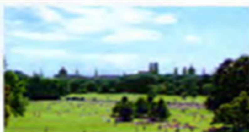
1 Blick vom Monopteros