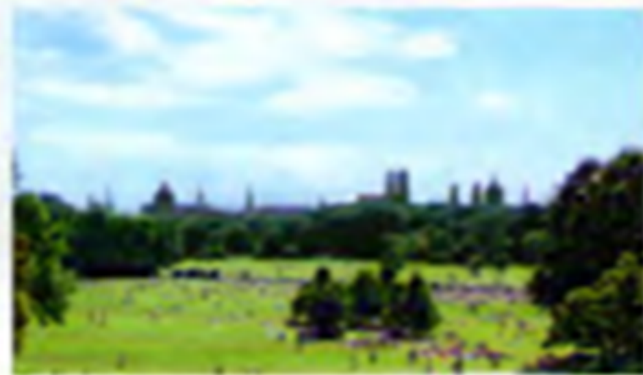
1 Blick vom Monopteros