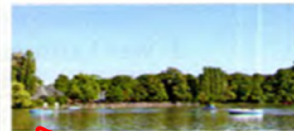
5 Kleinhesseloher See

Der Englische Garten in München ist mehr als 200 Jahre alt und er ist seit 1792 für alle Menschen geöffnet. Wir finden das heute ganz normal, aber im 18. Jahrhundert war es noch etwas Besonderes. So viel ‚Volksnähe‘ war in den meisten Ländern Europas nämlich noch nicht üblich.