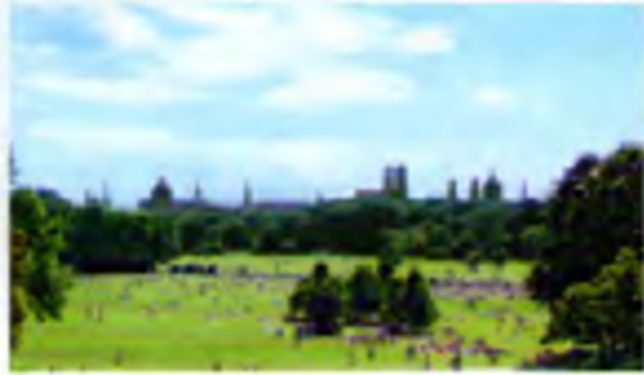
① Blick vom Monopteros