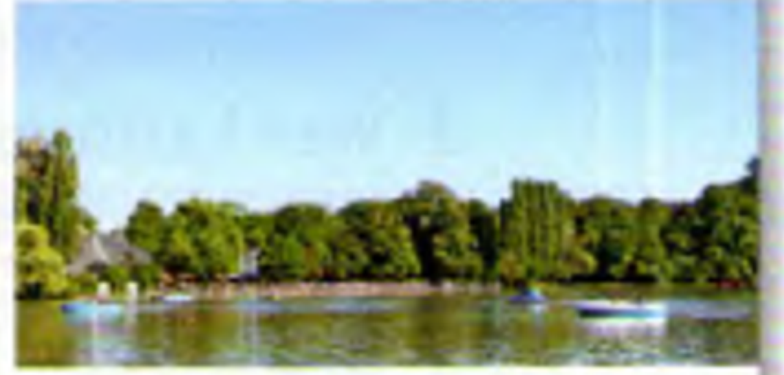
○ Kleinhesseloher See

20 Nach einem Kilometer komme ich zum Chinesischen Turm. Den finde ich besonders toll. Er ist 25 Meter hoch und ganz aus Holz. Auch hier gibt es einen Biergarten. Er hat 7.000 Sitzplätze und ist bei Einheimischen und Touristen sehr beliebt. Manchmal spielt 25 im Turm eine bayrische Blasmusik für die Gäste.