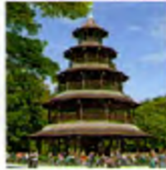
○ Chinesischer Turm