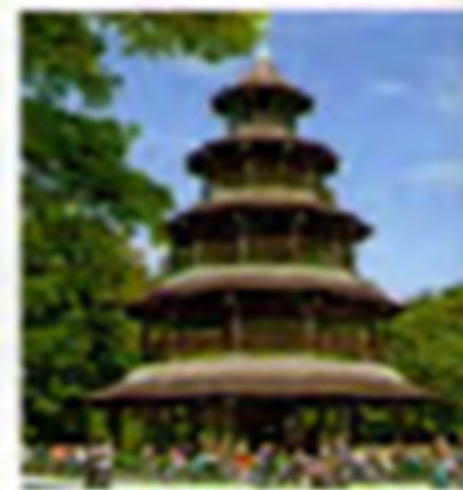
3 Chinesische Turm